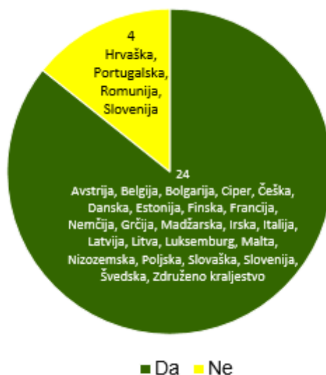
Slika 3: Države članice, v katerih kazni vključujejo zaseg ali zaplembo pošiljk lesa.