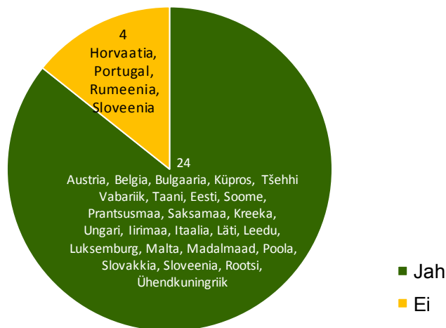
Joonis 3. Liikmesriigid, kus on kehtestatud puidusaadete kinnipidamist või konfiskeerimist hõlmavad sanktsioonid.