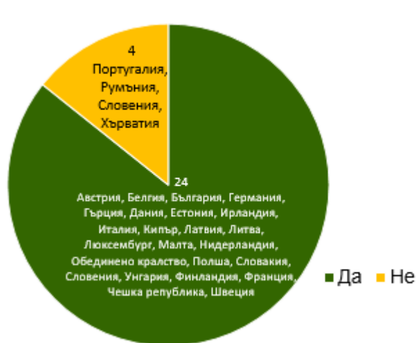
Фигура 3: Държави членки със санкции, които включват изземването или конфискацията на пратки с дървен материал.

В съответствие с член 5, параграф 7 от Регламента за FLEGT митническите органи могат временно да спрат или да задържат изделията от дървен материал, когато имат причини да смятат, че разрешителното FLEGT може да е невалидно. Двадесет и четири държави членки докладваха, че могат да изземват изделия от дървен материал и че в националното им законодателство е предвидена възможност за разпореждане с конфискуваната дървесина (фигура 3). В случаите, в които в националното законодателство е предвидено разпореждане с конфискуваната дървесина, 9 държави членки докладваха, че това е отговорност на митниците, 4 държави членки докладваха, че това е отговорност на КО, 5 държави членки докладваха, че това е отговорност на друга институция успоредно с КО и/или митниците, и 5 държави членки докладваха, че това е отговорност на институция, различна от КО или митниците.