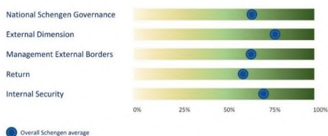
Zbirni pregled stanja iz prosinca 2025.

Pregled stanja na šengenskom području za 2025. (60) otkriva da države članice na razne načine doprinose funkcioniranju šengenskog područja: