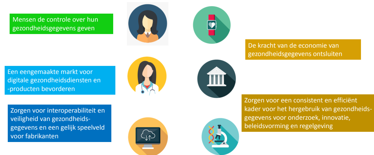
Figuur 1 — Belangrijkste doelstellingen van de Europese ruimte voor gezondheidsgegevens

Om het potentieel van gezondheidsgegevens te benutten, presenteert de Commissie een wetgevingsvoorstel om een Europese ruimte voor gezondheidsgegevens tot stand te brengen, personen zeggenschap over hun eigen gezondheidsgegevens te geven en het gebruik van die gegevens mogelijk te maken voor een betere gezondheidszorg, en om de EU in staat te stellen ten volle gebruik te maken van het potentieel dat wordt geboden door een veilige en beveiligde uitwisseling, gebruik en hergebruik van gezondheidsgegevens, zonder de huidige belemmeringen.