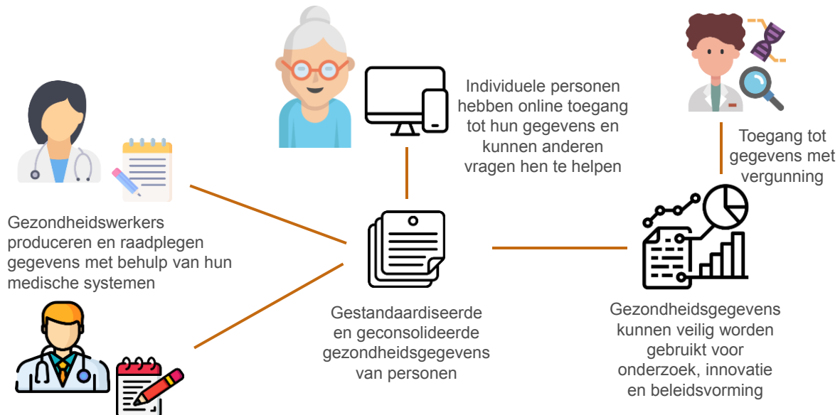
Figuur 3 — Primair en secundair gebruik van elektronische gezondheidsdossiers

Voor de ontwikkeling van een werkelijk gemeenschappelijke Europese ruimte voor gezondheidsgegevens zijn maatregelen op nationaal en EU-niveau nodig, alsmede nauwe samenwerking tussen publieke en private belanghebbenden (bijvoorbeeld nationale digitale gezondheidsinstanties, volksgezondheidsinstellingen, gegevensbeschermingsautoriteiten, zorgaanbieders, gezondheidswerkers, academische en onderzoeksinstituten en patiëntenverenigingen).