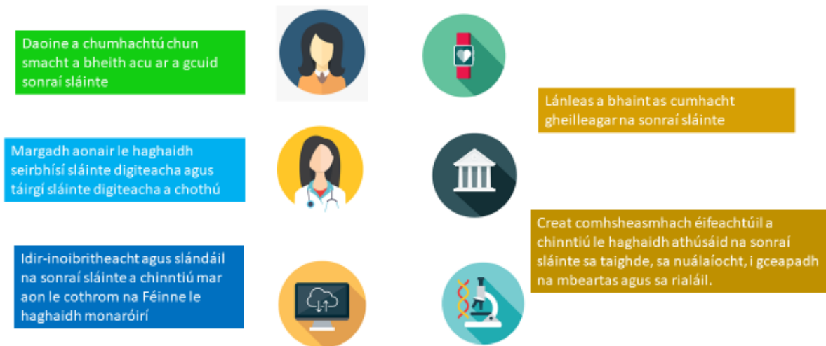
Fíor 1 - Príomhchuspóirí Spás Eorpach na Sonraí Sláinte

dhaoine smacht a fháil ar a gcuid sonraí sláinte féin, chun gur féidir na sonraí sin a úsáid chun feabhas a chur ar sholáthar an chúraim sláinte, agus chun a chur ar a chumas don Aontas lánleas a bhaint as an acmhainneacht a ghabhann le malartú, úsáid agus athúsáid shlán shábháilte na sonraí sláinte, gan na bacainní atá ann faoi láthair.