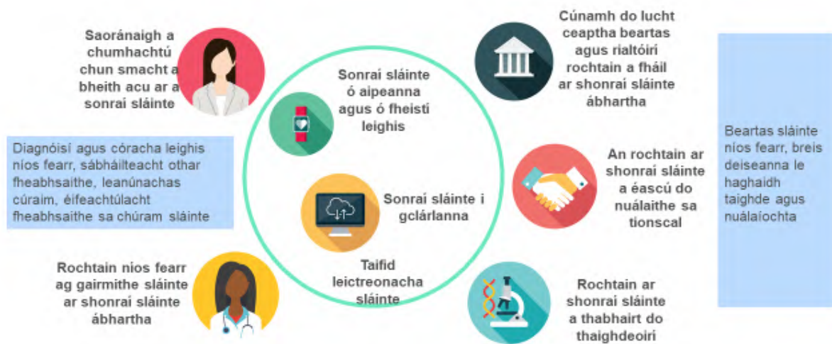
Fíor 4. Buntáistí d'úsáideoirí Spás Eorpach na Sonraí Sláinte

Beidh níos mó smachta ag daoine aonair ar a gcuid sonraí sláinte. Más mian leo, beidh siad in ann a gcuid sonraí a sholáthar don ghairmí cúraim sláinte dá rogha féin go tapa agus é sin a dhéanamh i bhformáid atá éasca, trédhearcach agus coiteann. Leis sin, tiocfaidh laghdú ar an méid tástálacha nach bhfuil gá leo agus ar na costais a bhaineann leo, agus méadóidh sé sábháilteacht cúraim sláinte. Leis an gcumas sonraí sláinte a rochtain, a anailisiú agus a roinnt, beidh an cúram sláinte níos éifeachtúla, beidh tacaíocht ann le haghaidh cinní leighis níos fearr agus, dá bhrí sin, tiocfaidh feabhas ar thorthaí sláinte. Cuideoidh Spás Eorpach na Sonraí Sláinte le fis an Choimisiúin maidir le claochlú digiteach an Aontais Eorpaigh a bhaint amach faoi 2030, is é sin, aidhm an Chompáis Dhigitigh 40 chun rochtain ar a dtaifid leighis agus ar an Dearbhú na bPrionsabal Digiteach 41 a chur ar fáil do 100 % de shaoránaigh. Cuirfidh sé leis an togra ón gCoimisiún le haghaidh Creat Eorpach maidir le Féiniúlacht Dhigiteach agus le Sparáin a chuirfidh ar chumas na saoránach rochtain iontaofa trasteorann a bheith acu ar a gcuid sonraí sláinte ó ghléasanna móibileacha.