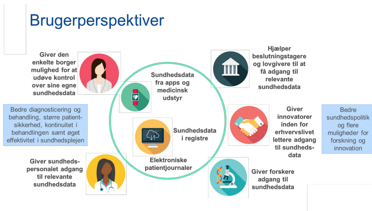
Figur 4. Fordele for brugere af det europæiske sundhedsdataområde

Det europæiske sundhedsdataområde vil være til gavn for den enkelte borger, sundhedspersonalet, sundhedstjenesteydere, forskere, lovgivere og politiske beslutningstagere.