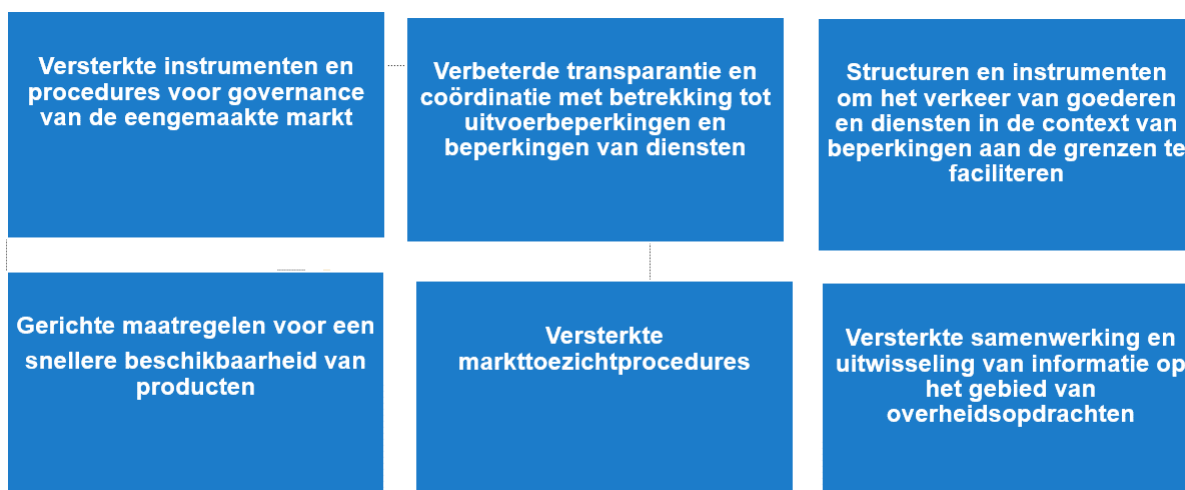
Figuur 2: Sleutelementen van het noodinstrument voor de eengemaakte markt

Ondanks het nut van de bestaande instrumenten van de eengemaakte markt heeft de crisis aangetoond dat deze voor noodsituaties kunnen worden verbeterd. Zoals aangekondigd door voorzitter Von der Leyen in februari 2021 16 zal de Commissie een noodinstrument voor de eengemaakte markt voorstellen als structurele oplossing om de beschikbaarheid en het vrije verkeer van personen, goederen en diensten in de context van mogelijke toekomstige crises te waarborgen. Dit instrument moet zorgen voor meer informatie-uitwisseling, coördinatie en solidariteit wanneer de lidstaten crisisgerelateerde maatregelen nemen. Het zal de negatieve gevolgen voor de eengemaakte markt helpen beperken, onder meer door te zorgen voor een doeltreffendere governance. Het moet ook een mechanisme opzetten aan de hand waarvan Europa kritieke producttekorten kan aanpakken door de beschikbaarheid van producten te versnellen (bv. het vaststellen en delen van normen, versnelde conformiteitsbeoordeling) en de samenwerking op het gebied van overheidsopdrachten te versterken. Het zal worden afgestemd op relevante beleidsinitiatieven, zoals het komende voorstel tot oprichting van een Europese autoriteit voor paraatheid en respons inzake noodsituaties op gezondheidsgebied (HERA), het komende noodplan voor vervoer en mobiliteit en de relevante internationale praktijk die gericht is op het aanpakken van noodsituaties of het waarborgen en versnellen van de beschikbaarheid van essentiële producten.