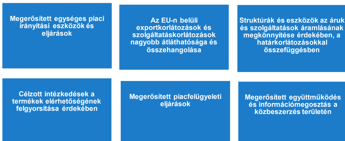
2. ábra: Az egységes piaci szükséghelyzeti eszköz legfontosabb elemei

A meglévő egységes piaci eszközök hasznossága ellenére a válság megmutatta, hogy van mit rajtuk javítani vészhelyzetek esetére. Ursula von der Leyen elnök 2021. februári bejelentésének 16 megfelelően a Bizottság javaslatot fog tenni egy egységes piaci szükséghelyzeti eszközre , amely strukturális megoldást nyújtana a személyek, áruk és szolgáltatások rendelkezésre állásának és szabad mozgásának biztosításához az esetleges jövőbeli válságok esetére. Az eszköz nagyobb fokú információmegosztást, koordinációt és szolidaritást garantálna válsággal kapcsolatos tagállami intézkedések elfogadásakor. Segíti majd az egységes piacra gyakorolt negatív hatások enyhítését, többek között a hatékonyabb irányítás biztosítása révén. Olyan mechanizmust is ki kell építenie, amelyen keresztül Európa a termékek elérhetőségének felgyorsításával (pl. szabványok meghatározása és megosztása, gyorsított megfelelésértékelés) és a közbeszerzési együttműködés megerősítésével képes kezelni a kritikus termékhiányt. A javaslat összhangban lesz a vonatkozó szakpolitikai kezdeményezésekkel, például az Európai Egészségügyi Szükséghelyzet-felkészültségi és -reagálási Hatóság (HERA) létrehozására irányuló közelgő javaslattal, a közlekedési és mobilitási vészhelyzeti tervvel, valamint a vészhelyzetek kezelésére vagy az alapvető termékek rendelkezésre állásának biztosítását és felgyorsítását célzó nemzetközi gyakorlattal.