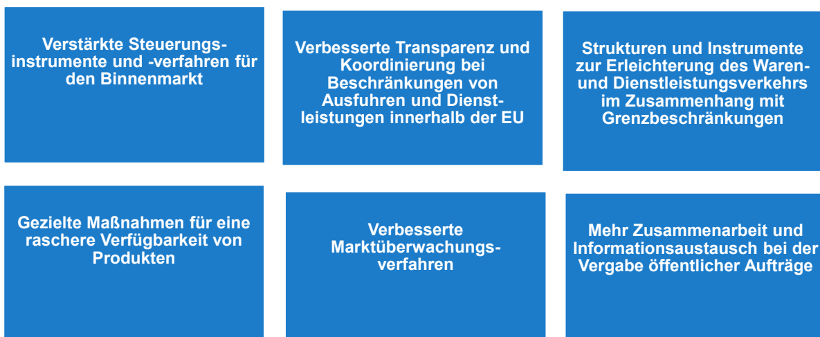
Abbildung 2 Kernelemente des Notfallinstruments für den Binnenmarkt