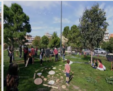
© NEB STAR – SOFTAcademy © SvenZacek – ©ASDpublics

Comisia intenționează să valorifice potențialul de transformare al NBE pentru a sprijini democrația locală , pentru a combate polarizarea tot mai mare din societățile noastre și pentru a consolida capacitatea de acțiune a comunităților, precum și parteneriatele public-privat locale. NBE vizează consolidarea capacităților autorităților publice și ale părților interesate de a integra practici participative și transdisciplinare reale în procesele de proiectare și decizionale ale proiectelor de dezvoltare locală, permițând astfel cetățenilor să își creeze în comun viitoarele cartiere adaptate la nevoile locale. NBE va sprijini transformarea locală prin utilizarea experimentării, inclusiv cu instrumente de realitate digitală și virtuală pentru ca cetățenii și profesioniștii să proiecteze, să creeze și să gestioneze în comun medii de viață favorabile incluziunii, frumoase și durabile.