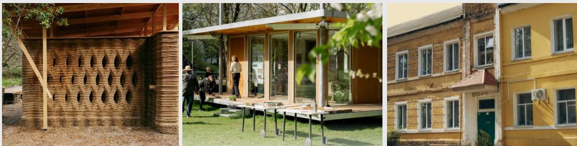
TOVA, © GregoriCivera. © NEBbourhoods. © TEPLO.