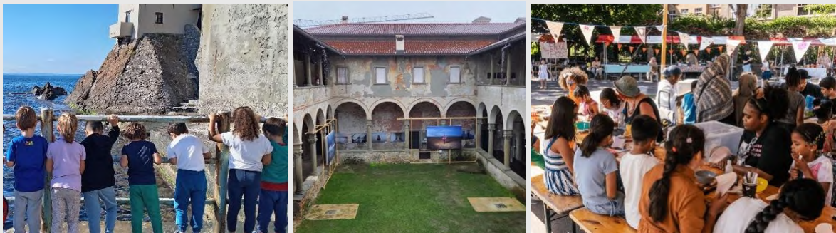
© Bauhaus of The Sea Sails. © Bauhaus4EU. © Cultuur&Campus.

Švietimas ir kultūra yra labai svarbūs norint didinti informuotumą apie naudą, kurią teikia holistinių ir bandomųjų metodų derinimas su faktais grindžiamo projektavimo metodikomis. Pasitelkdama koaliciją „Education4Climate“ 28 ir vykdydama savo veiklą, susijusią su tvarumo siekiu grindžiama mokyklų mokymosi aplinka 29 , Komisija propaguos NEB vertybes visos Europos mokyklose.