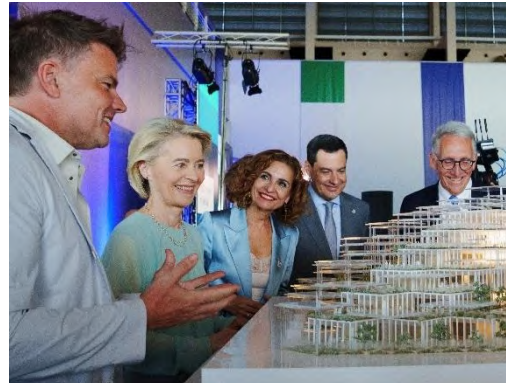
Das künftige Gebäude der Gemeinsamen Forschungsstelle in Sevilla, das nach den Werten und Grundsätzen des Neuen Europäischen Bauhauses errichtet wird