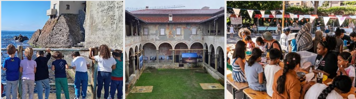
© Bauhaus of The Sea Sails - © Bauhaus4EU - © Cultuur&Campus

Anwohnerinnen und Anwohner einzubinden und Geschichten zu dokumentieren [Horizont Europa].