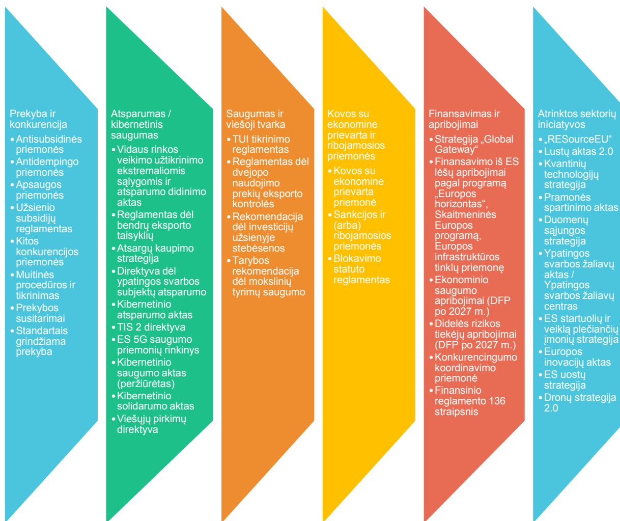
1 diagrama. Priemonių, kuriomis remiamas ekonominis saugumas, sąrašas (nebaigtinis)

Siekdama didinti ES ekonominį saugumą, Komisija, koordinuodama veiksmus su valstybėmis narėmis, šias priemones naudos taip: