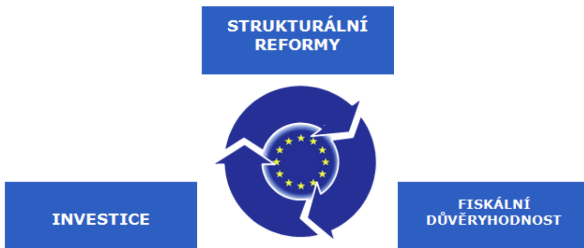
Graf č. 1: Integrovaný přístup

Pro znovunastolení důvěry, snížení nejistoty, která brání investicím, a maximální využití vzájemného a současného působení všech tří pilířů je zásadní simultánní akce ve všech třech oblastech. Zejména je zřejmé, že pro udržitelnost veřejných financí a pro uvolnění investic bude zásadní obnovený závazek ke strukturálním reformám.