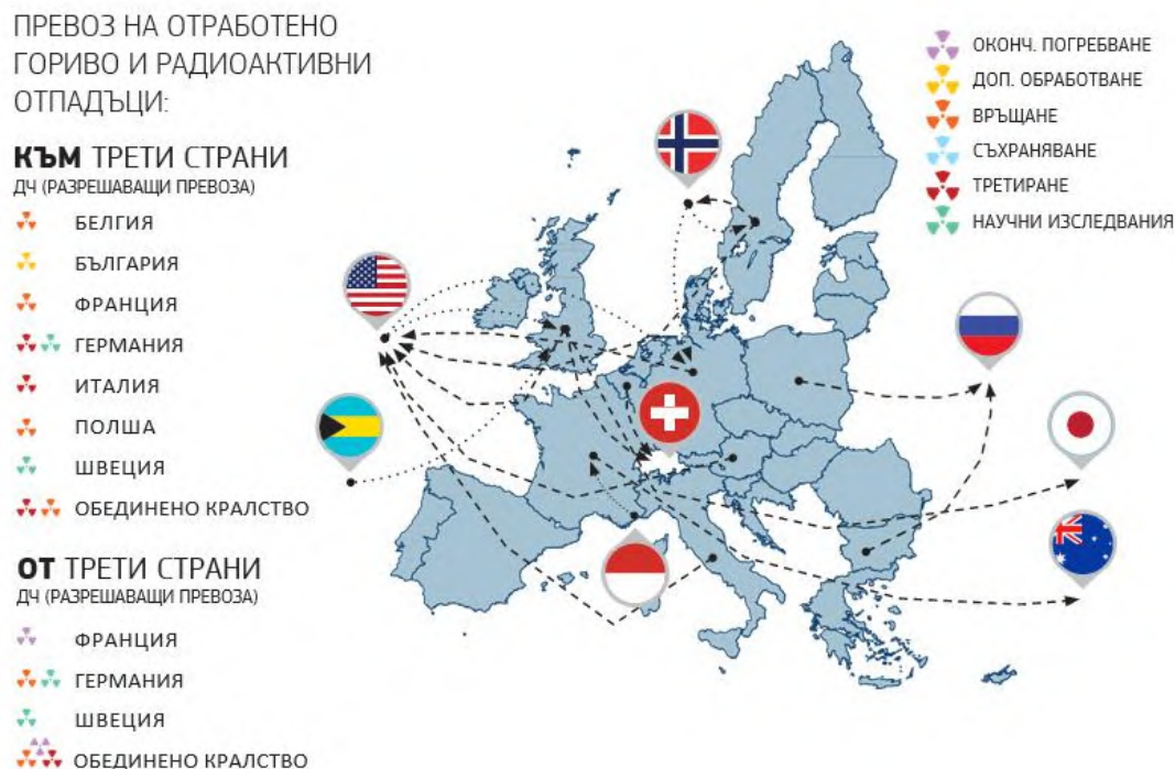
Фигура 2. Превози извън територията на Общността през 2015—2017 г. 30

Само един транзитен превоз с произход от трета държава е бил разрешен през 2015—2017 г.