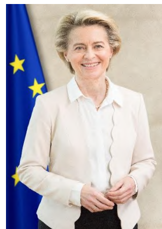
Урсула фон дер Лайен Председател на Европейската

Прилагането на правото на ЕС също е от ключово значение. Опитът показва, че най-бързият начин за прилагане на нашите правила е чрез сътрудничество с държавите членки. През първите седем месеца на 2025 г. Комисията стартира 168 диалога преди започване на производство за установяване на нарушение. В рамките на две трети от приключените диалози решихме разглеждания въпрос. През същия период започнахме и 373 производства за установяване на нарушение и приключихме почти толкова от тях. 95 % от производствата бяха приключени, преди да се наложи да сезираме Съда по тях. Това означава повече сигурност за европейците и възможност да се възползват по-бързо от предимствата на европейските политики. Нашата цел е винаги да гарантираме, че договорените заедно правила се прилагат в пълна степен възможно най-бързо, така че те да могат да доведат до реална промяна за гражданите на Европа.