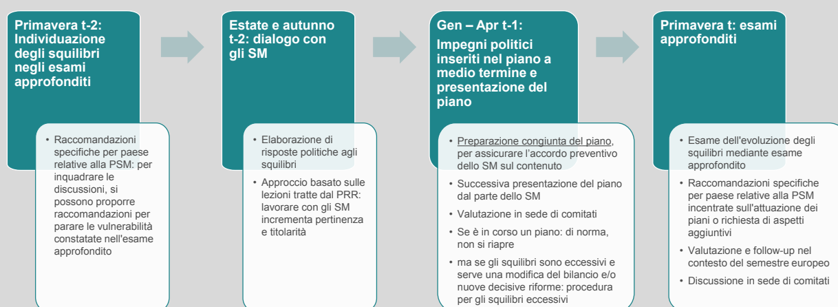
Figura 1 - Calendario della risposta politica in caso di constatazione di squilibrio con il nuovo piano nazionale a medio termine

Durante il periodo di validità del piano nazionale a medio termine è individuata una nuova fonte di squilibrio.