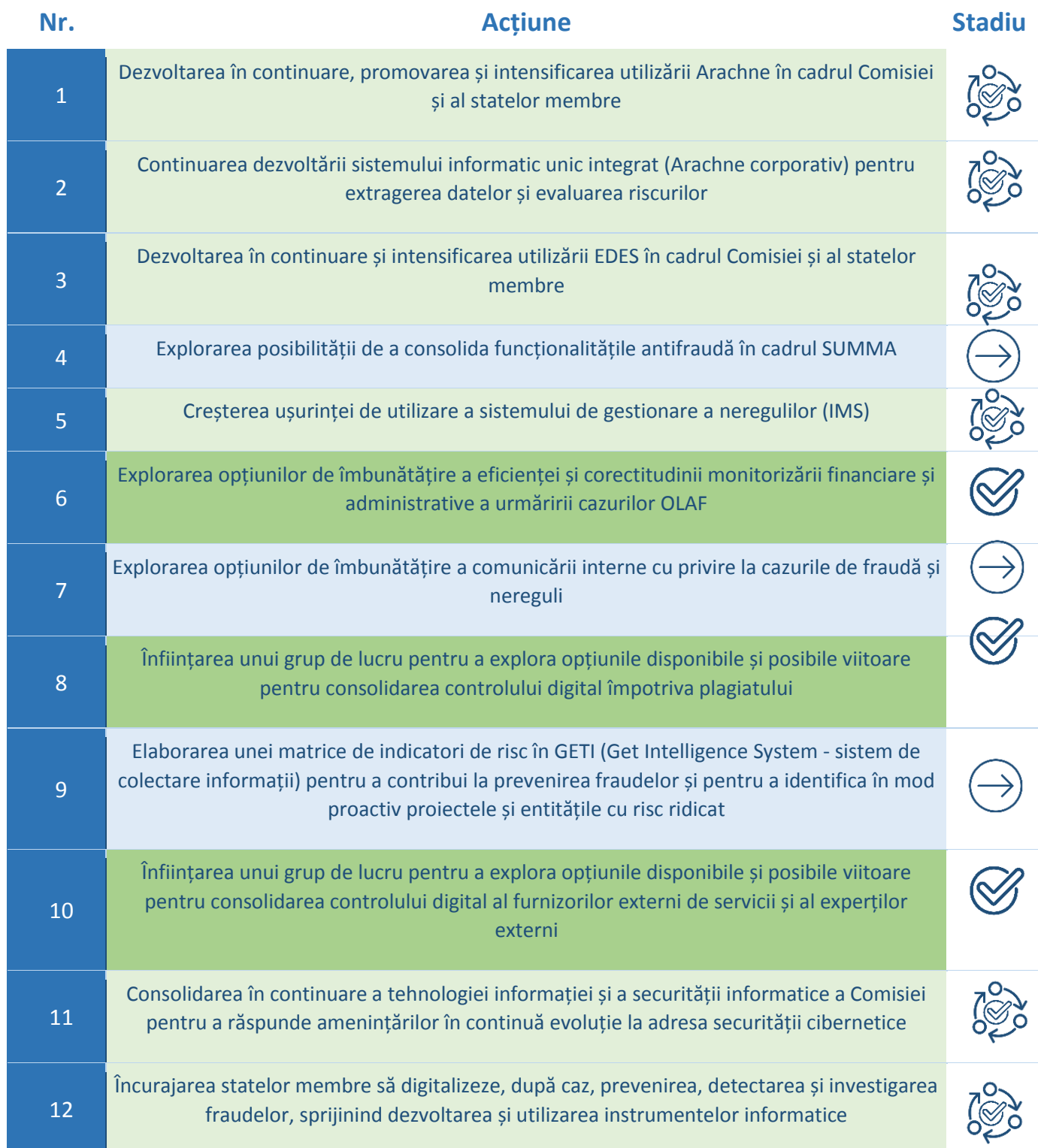
Tabelul 3: Stadiul punerii în aplicare a acțiunilor legate de tema „Promovarea digitalizării și a utilizării instrumentelor informatice pentru combaterea fraudei” (secțiunea 3.1)