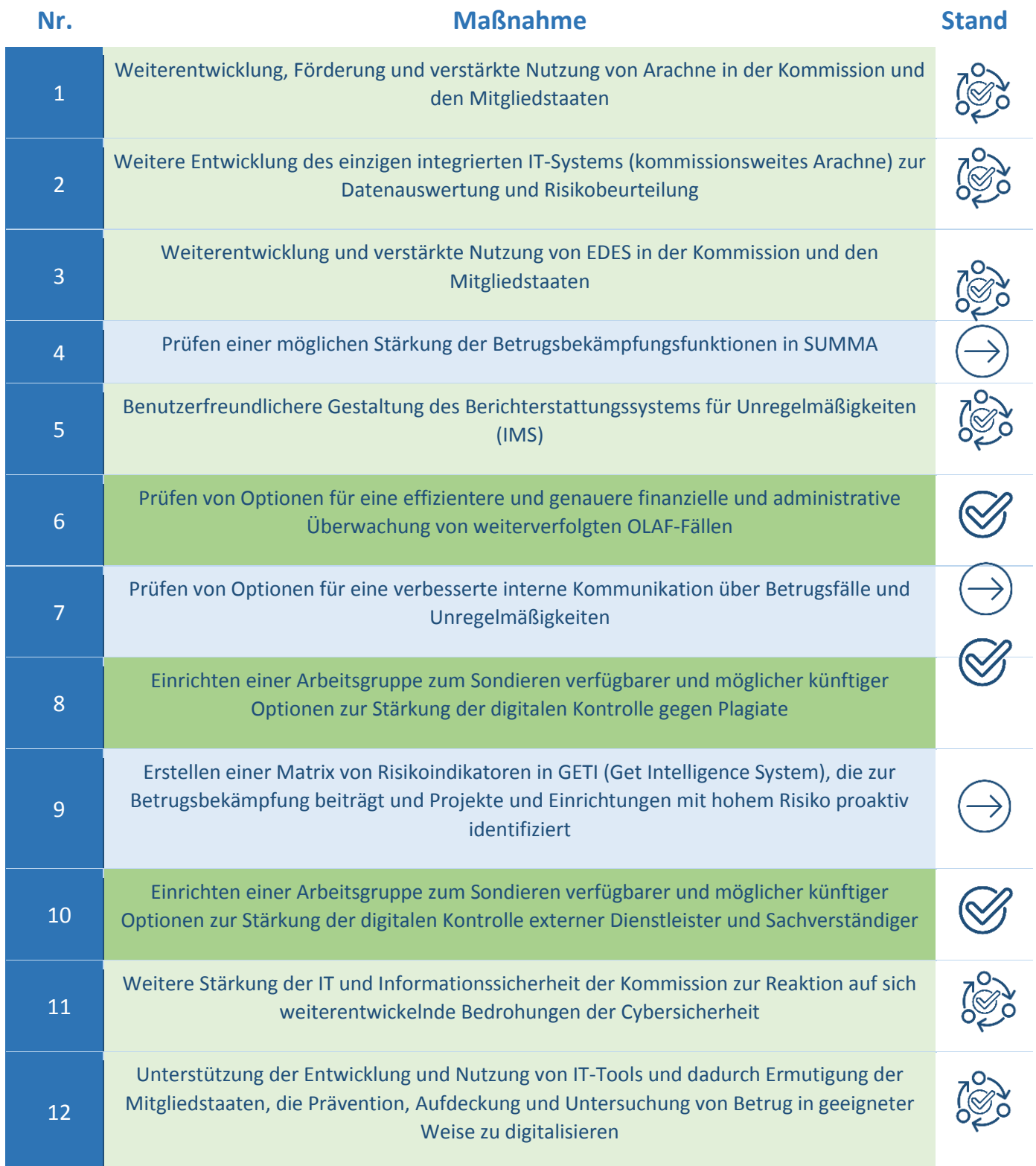
Tabelle 3: Umsetzungsstand der Maßnahmen bezüglich der „Förderung der Digitalisierung und des Einsatzes von IT-Tools zur Betrugsbekämpfung“ (Abschnitt 3.1)