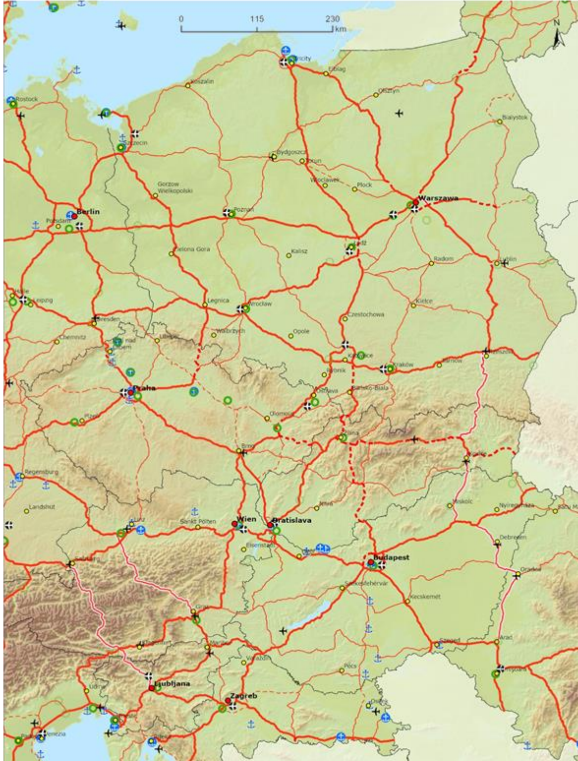
Drumuri - centrală Drumuri - centr. ext. Drumuri - globală Glob./Centr. Nod urban

BE BG CZ DK DE EE IE EL ES FR HR IT CY LV LT LU HU MT NL AT PL PT RO SI SK FI SE