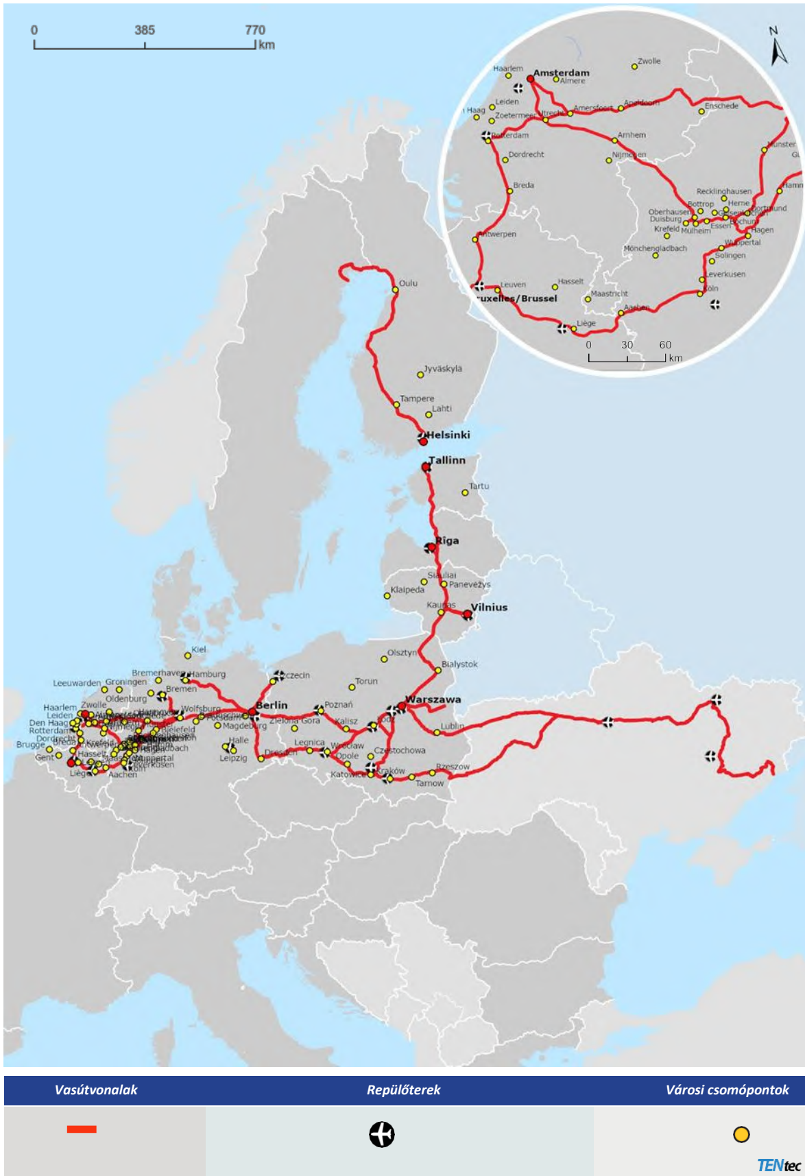
A térképnek a folyosó harmadik országbeli nyomvonalára vonatkozó részei indikatív jellegűek.

BE BG CZ DK DE EE IE EL ES FR HR IT CY LV LT LU HU MT NL AT PL PT RO SI SK FI SE | UA