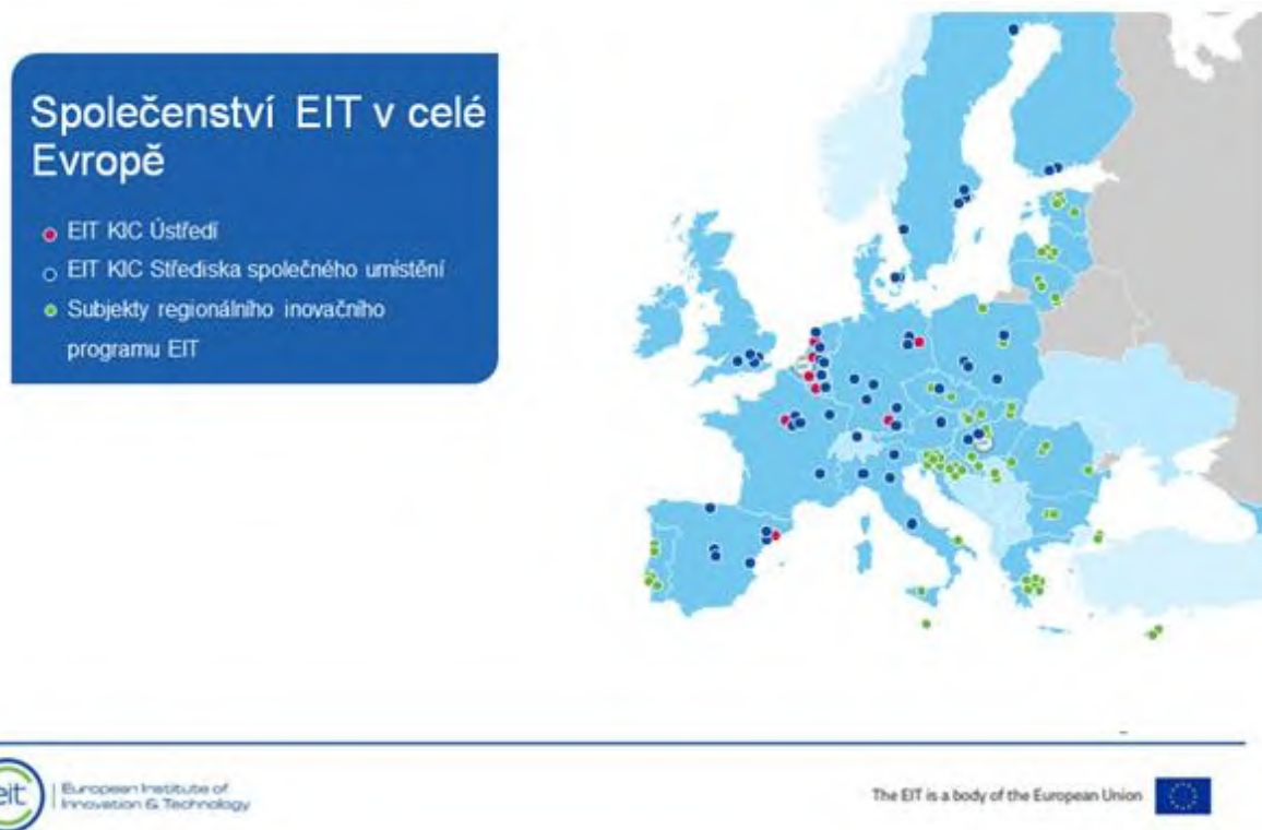
Obrázek 3: EIT v Evropě

V souvislosti s přetrvávajícími regionálními rozdíly v inovační výkonnosti zahájil EIT v roce 2014 regionální inovační program, aby svůj dosah rozšířil na země s nízkou a mírnou výkonností v oblasti inovací. Prostřednictvím regionálního inovačního programu rozšířil EIT své činnosti v celé Evropě a nabízí nyní příležitosti pro regiony s nízkou inovační výkonností, aby se zapojily do činností v rámci znalostního trojúhelníku jako součást znalostních a inovačních společenství. To se odráží také v podílu finančních prostředků EIT přidělených partnerům EU-13 (8,3 % ve srovnání s 4,8 % v programu Horizont 2020, stav k roku 2018).