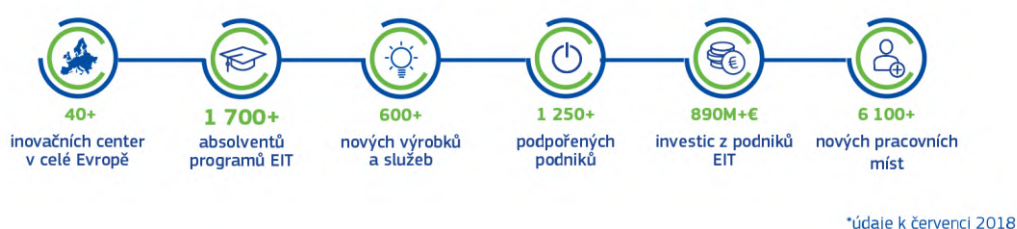
Obrázek 1: aktuální výsledky EIT, zdroj: EIT

Znalostní a inovační společenství představují dynamické inovační ekosystémy, které produkují širokou škálu výsledků (viz obrázek 1).